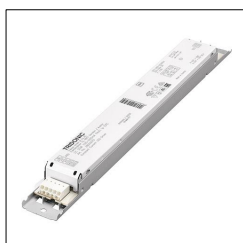
LED-Treiber LC 25W 100-500mA flexC Ip EXC 28000679

Das beschriebene Produkt dient als deklarierte Einheit. Die EPD umfasst eine Produktbeschreibung, Daten zu Materialzusammensetzung, Herstellung, Transport, Nutzungsstadium, Entsorgung und Recycling sowie die Ergebnisse der Ökobilanz. EPDs von Bauprodukten sind nur dann vergleichbar, wenn die jeweiligen Ökobilanzen nach denselben PCRs und entsprechenden, verbindlichen Nutzungsszenarien berechnet werden.