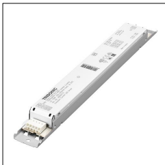
LED-Treiber LC 75W 100-400mA flexC Ip EXC 28000713