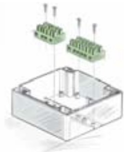
Nocken für Klemmsteine z.B. (Typ KL 16, Fa. Wieland)