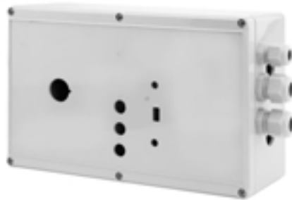
F-Version: Mit vertiefter Fläche im Oberteil für die bündige Montage von Folientastaturen.