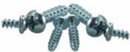
Wir empfehlen die Befestigung von Montageplatten und Tragschienen mit selbstformenden Schrauben (Allgemeines Zubehör).