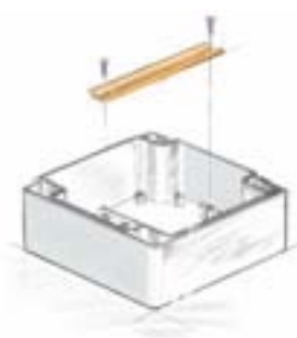
Nocken mit seitlichen Auflagestegen für kippsichere Tragschienenmontage.