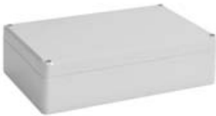
Version mit glatter Gehäuseoberfläche