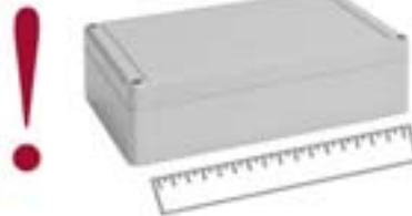
ABS-Gehäuse können aufgrund einer anderen Materialschwindung ca. 0,1 - 0,25% größer sein.