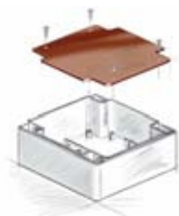
Standard-Montageplattenbefestigung, zum Teil auch im Deckel vorhanden.