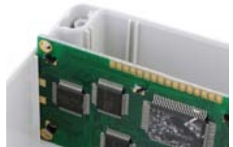
LP-Version: Mit Einschubnuten für Leiterkarten im Unterteil.