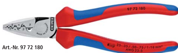
Art.-Nr. 97 72 180