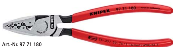
Art.-Nr. 97 71 180