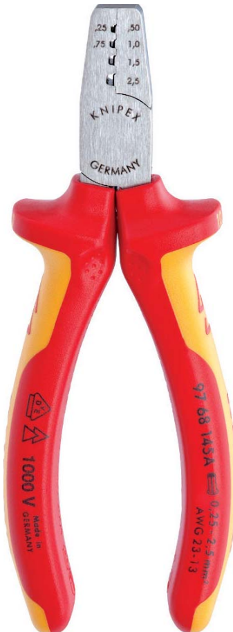
Art.-Nr. 97 68 145 A