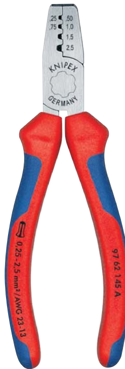
Art.-Nr. 97 62 145 A