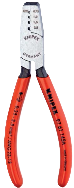
Art.-Nr. 97 61 145 A