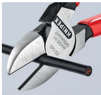
Mit den präzisen Schneiden durchtrennt der Seitenschneider weiche und harte Drähte – dünne Cu-Drähte sogar mit den Schneidenspitzen