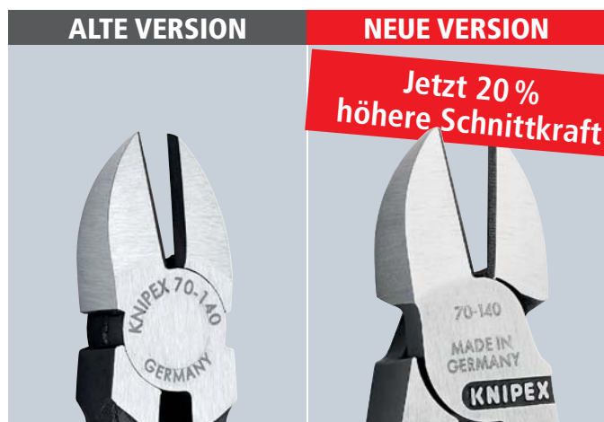
Die neue und stabilere Gelenkgestaltung macht den Seitenschneider schneidstark wie nie zuvor