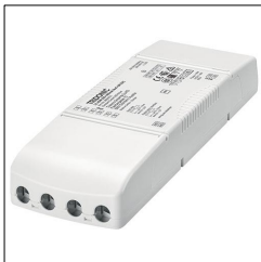
LED-Treiber LC 45W 500-1400mA flexC SR EXC 28000701