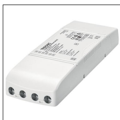
LED-Treiber LC 45W 500-1400mA flexC SR EXC 28000701

Das beschriebene Produkt dient als deklarierte Einheit. Die EPD umfasst eine Produktbeschreibung, Daten zu Materialzusammensetzung, Herstellung, Transport, Nutzungsstadium, Entsorgung und Recycling sowie die Ergebnisse der Ökobilanz. EPDs von Bauprodukten sind nur dann vergleichbar, wenn die jeweiligen Ökobilanzen nach denselben PCRs und entsprechenden, verbindlichen Nutzungsszenarien berechnet werden.