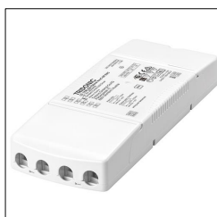
LED-Treiber LC 17W 250-700mA flexC SR EXC 28000699

Das beschriebene Produkt dient als deklarierte Einheit. Die EPD umfasst eine Produktbeschreibung, Daten zu Materialzusammensetzung, Herstellung, Transport, Nutzungsstadium, Entsorgung und Recycling sowie die Ergebnisse der Ökobilanz. EPDs von Bauprodukten sind nur dann vergleichbar, wenn die jeweiligen Ökobilanzen nach denselben PCRs und entsprechenden, verbindlichen Nutzungsszenarien berechnet werden.