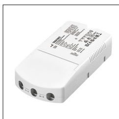
LED-Treiber LC 27/100-500/54 NF SR EXC3 87500962