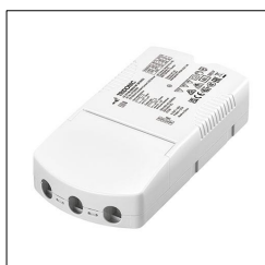
LED-Treiber LC 27/100-500/54 NF SR EXC3 87500962

Das beschriebene Produkt dient als deklarierte Einheit. Die EPD umfasst eine Produktbeschreibung, Daten zu Materialzusammensetzung, Herstellung, Transport, Nutzungsstadium, Entsorgung und Recycling sowie die Ergebnisse der Ökobilanz. EPDs von Bauprodukten sind nur dann vergleichbar, wenn die jeweiligen Ökobilanzen nach denselben PCRs und entsprechenden, verbindlichen Nutzungsszenarien berechnet werden.