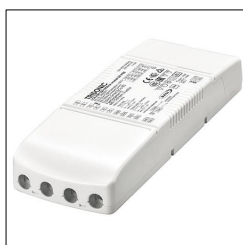
LED-Treiber LCA 25W 350-1050mA one4all SR PRE 28000671