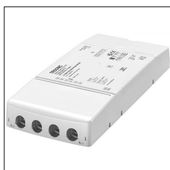
LED-Treiber LC 100W 1100-2100mA flexC SR EXC 28001573

Das beschriebene Produkt dient als deklarierte Einheit. Die EPD umfasst eine Produktbeschreibung, Daten zu Materialzusammensetzung, Herstellung, Transport, Nutzungsstadium, Entsorgung und Recycling sowie die Ergebnisse der Ökobilanz. EPDs von Bauprodukten sind nur dann vergleichbar, wenn die jeweiligen Ökobilanzen nach denselben PCRs und entsprechenden, verbindlichen Nutzungsszenarien berechnet werden.