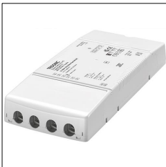
LED-Treiber LC 100W 1100-2100mA flexC SR EXC 28001573