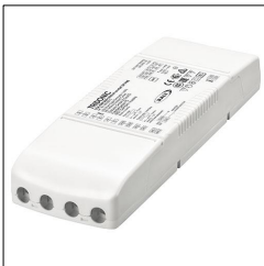
LED-Treiber LCA 45W 500-1400mA one4all SR PRE 28000672