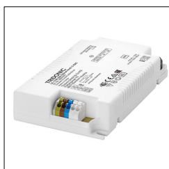
LED-Treiber LC 17W 250-700mA flexC C EXC 28000693

Das beschriebene Produkt dient als deklarierte Einheit. Die EPD umfasst eine Produktbeschreibung, Daten zu Materialzusammensetzung, Herstellung, Transport, Nutzungsstadium, Entsorgung und Recycling sowie die Ergebnisse der Ökobilanz. EPDs von Bauprodukten sind nur dann vergleichbar, wenn die jeweiligen Ökobilanzen nach denselben PCRs und entsprechenden, verbindlichen Nutzungsszenarien berechnet werden.