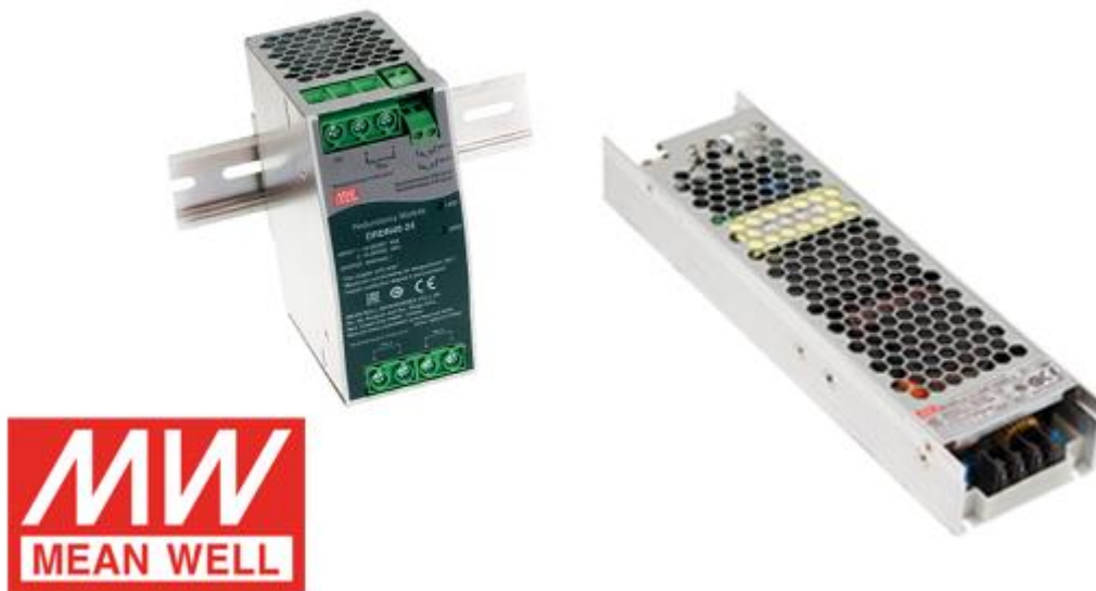
Abbildung 1: Abbildung der All-In-One DC-USV DRS-480 (links) und des 500-Watt-Netzteils UHP-500R mit integrierter Redundanzfunktion (rechts)

Mit zunehmender Automatisierung und wachsender technischer Komplexität steigen die Anforderungen an die Zuverlässigkeit von Stromversorgungssystemen. Besonders in sicherheitskritischen Umgebungen kann ein Ausfall der Versorgung gravierende Folgekosten oder Datenverluste verursachen. Um Anlagen rund um die Uhr abzusichern und teure Stillstände zu vermeiden, werden daher immer häufiger redundante Stromversorgungskonzepte eingesetzt.