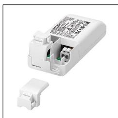
LED-Treiber LC 20/100-1050/44 NF SR EXC3 87500961

Das beschriebene Produkt dient als deklarierte Einheit. Die EPD umfasst eine Produktbeschreibung, Daten zu Materialzusammensetzung, Herstellung, Transport, Nutzungsstadium, Entsorgung und Recycling sowie die Ergebnisse der Ökobilanz. EPDs von Bauprodukten sind nur dann vergleichbar, wenn die jeweiligen Ökobilanzen nach denselben PCRs und entsprechenden, verbindlichen Nutzungsszenarien berechnet werden.