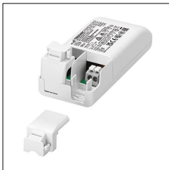
LED-Treiber LC 20/100-1050/44 NF SR EXC3 87500961