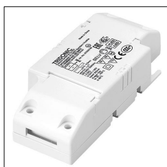
LED-Treiber LC 15/350/43 fixC SR SNC2 87500747

Das beschriebene Produkt dient als deklarierte Einheit. Die EPD umfasst eine Produktbeschreibung, Daten zu Materialzusammensetzung, Herstellung, Transport, Nutzungsstadium, Entsorgung und Recycling sowie die Ergebnisse der Ökobilanz. EPDs von Bauprodukten sind nur dann vergleichbar, wenn die jeweiligen Ökobilanzen nach denselben PCRs und entsprechenden, verbindlichen Nutzungsszenarien berechnet werden.