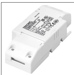
LED-Treiber LC 15/350/43 fixC SR SNC2 87500747